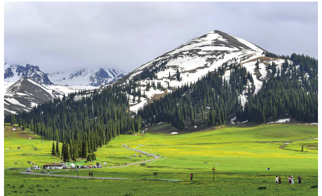
新疆文旅资源得天独厚，种类齐全、数量众多，大美新疆品牌响亮、深入人心。

文化是旅游的灵魂，旅游是文化的载体。新疆文旅资源得天独厚，种类齐全、数量众多，大美新疆品牌响亮、深入人心，在未来全国旅游消费三大趋势“小众独特、自在休闲、深度体验”方面亦占得先机，旅游业高质量发展优势十分明显，潜力巨大。展望未来，新疆要